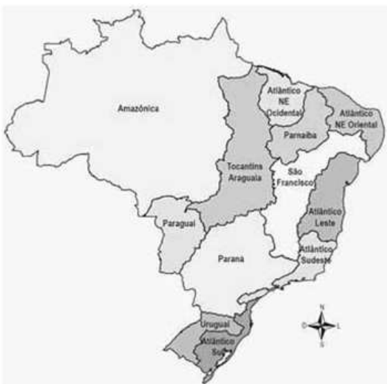
Principais Bacias Hidrográficas do Brasil.

Tomando o mapa a seguir como referência inicial e refletindo acerca da questão energética no Brasil, assinale a alternativa correta.