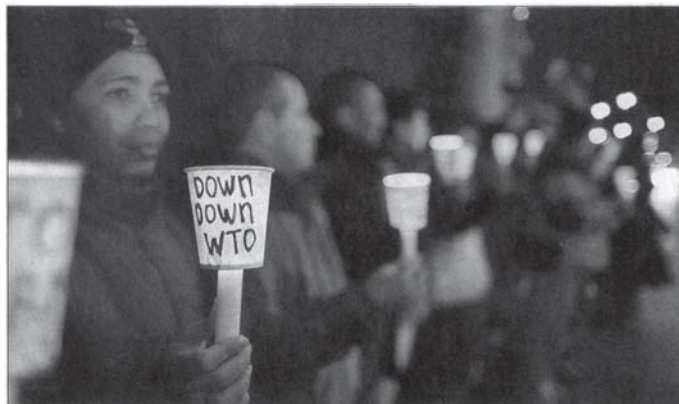
EM PROTESTO em Genebra, manifestantes antiglobalização seguram velas com os dizeres “abaixo a OMC”